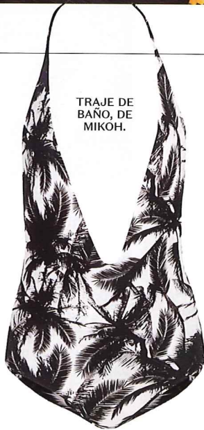
TRAJE DE BAÑO, DE MIKOH.

Un escenario perfecto rodeado de palmeras, mar turquesa y cielo azul. Estos son los elementos clave de una urbe que las firmas más importantes de la industria de la moda han adoptado como suya.