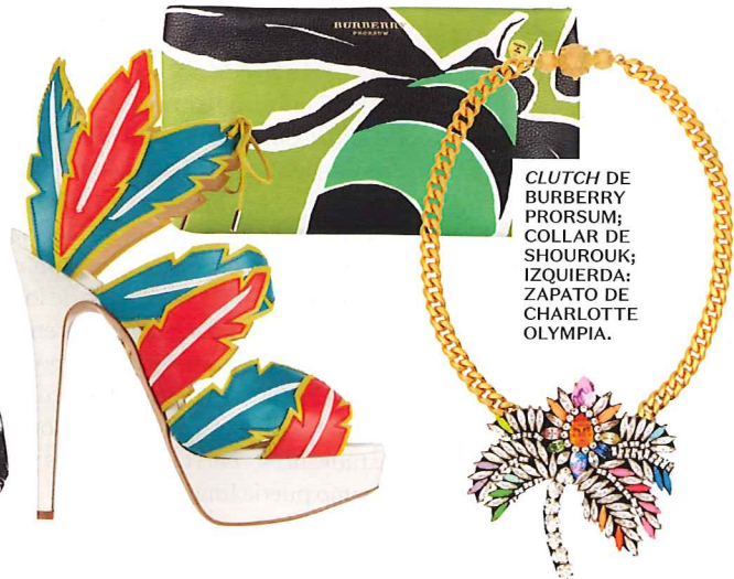
CLUTCH DE BURBERRY PRORSUM; COLLAR DE SHOUROUK; IZQUIERDA: ZAPATO DE CHARLOTTE OLYMPIA.