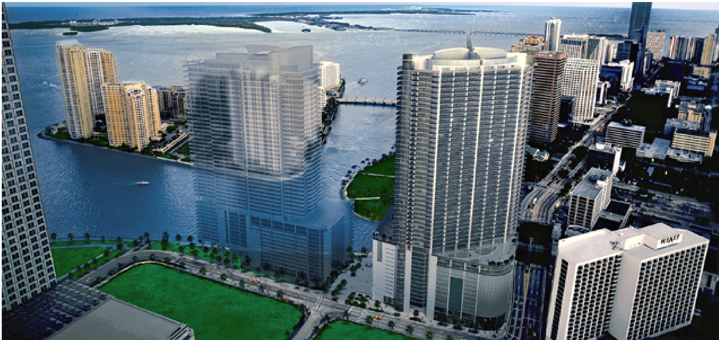
Vista sureste del edificio, donde el Río de Miami desemboca en Biscayne Bay.

Subdirector Comercial: Agustín Correa. Gerente de Ventas: Cinthya Ángeles. Editor: José Luis Jáuregui. | 5628 7482 | empresas@reforma.com