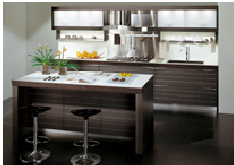
Todas las residencias EPIC ofrecerán detalles interiores de gran calidad.